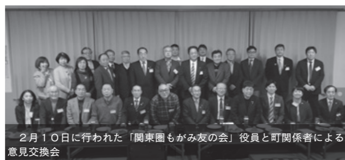
2月10日に行われた「関東圏もがみ友の会」役員と町関係者による意見交換会

また、集落のボランティア活動で、燃料代・除雪機借り上げ代等の活動費について不安なく取り組めるよう、予算に限りはありますが地域間連携推進交付金を活用してまいります。