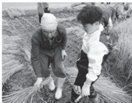
鎌を使つての稲刈り体験

休日や夏休みを使って運営する活動です。 親倉見地区の森林の中で自然に触れる活動を中心に、米作りやキノコ栽培が体験できます。年末には自分たちで作ったもち米で餅をつき、お世話になった地域の方々への感謝の会を開いています。 夏休みに行なっているキャンプ体験は、新型コロナウイルスの流行により、一時中断していましたが、今年はいくつかの要望を受け再開され、大勢の子どもたちと支援する大人で賑わいました。「わんぱく学校」OBの中学生が、サポーターとして参加することも特色となっています。