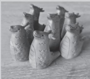
作成した干支の置物

また、年間通してカムロ窯での体験対応や物販、町内外イベントへの参加、SNSでの情報発信、商品開発などを行ってきました。 この1年を振り返ると、イベントへの出店やメディアへの出演、地域サロン等多様な団体との関わりが増えるなど、カムロ窯のPRにつながった活動が多かったと感じています。来年も引き続きカムロ窯のPRに力を注ぎ、結果として最上町への誘客につながるよう活動していきたいと思っています。