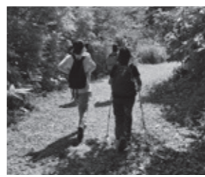
▲鳴子峡の大自然を満喫できます！

鳴子峡レストハウスから鳴子温泉駅までの10キロメートルのコースには、鳴子峡を中心とした大自然や「奥の細道」があり、自然や歴史を感じながら歩くことができます。ゴールの鳴子温泉駅には足湯があり、足の疲れを癒すことができます。（11月下旬〜4月下旬まで冬季閉鎖）