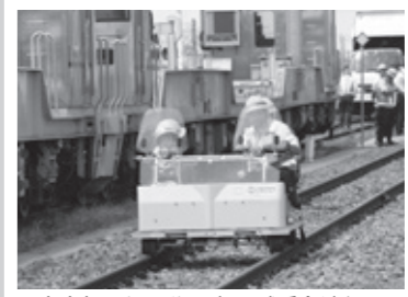
▲大人気のレールスター試乗会は必見！

毎年8月に小牛田駅構内で開催される「えきフェスMISATO」では、車両の展示やレールスター試乗会、ミニSLなどが用意され、多くの来場者でにぎわいます。皆さんぜひ、電車を利用して美里町に遊びに来てください。