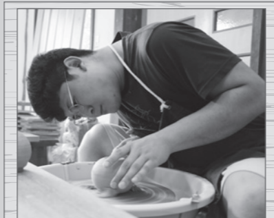
こんにちは！ 今月号は川和田です！

ドライバーで釘を打ったかのような力強い音がします。陶芸館の外壁（木製）には無数の穴があり、穴を開けそこに住む鳥「キツツキ（ゲラ）」の仕業でした。キツツキは巣を作るために穴を開けているとばかり思っていました。打突音を鳴らすことで仲間とコミュニケーションをとる習性があるそうです。今後ともキツツキ対策を取らなければ外壁が穴だらけになりそうです。