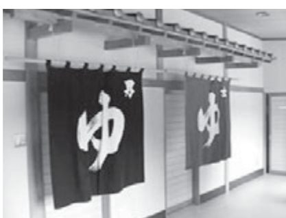
▲コロナ対策をしておの営業