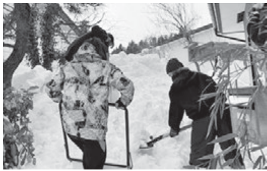
▲最上校イエローダンパーズ

問 大雪の影響で除雪費用がかさむなか柔軟な福祉行政はできないのか？ 答 独り暮らしの高齢者が280人以上おられますが、皆で支え合う仕組みの中で料金設定の基本的な考え方も検討する必要があります。商工会との連携雪下ろし・除雪ボランティアもありますが、町として雪処理・雪対策をしっかりと進めて参りたい。