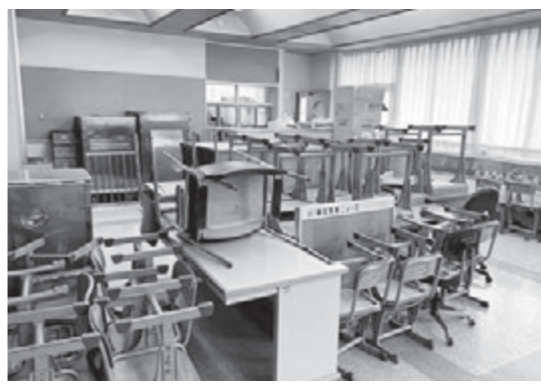
▲閉校小学校の備品活用が望まれる

答 国からは普通交付税と特別交付税合わせて1億9千万円程度の歳入があり一般会計からは、およそ4億円を繰り出しています。町民の命を守る使命を果たしながら出来る限り財政支出の圧縮を図っていきます。