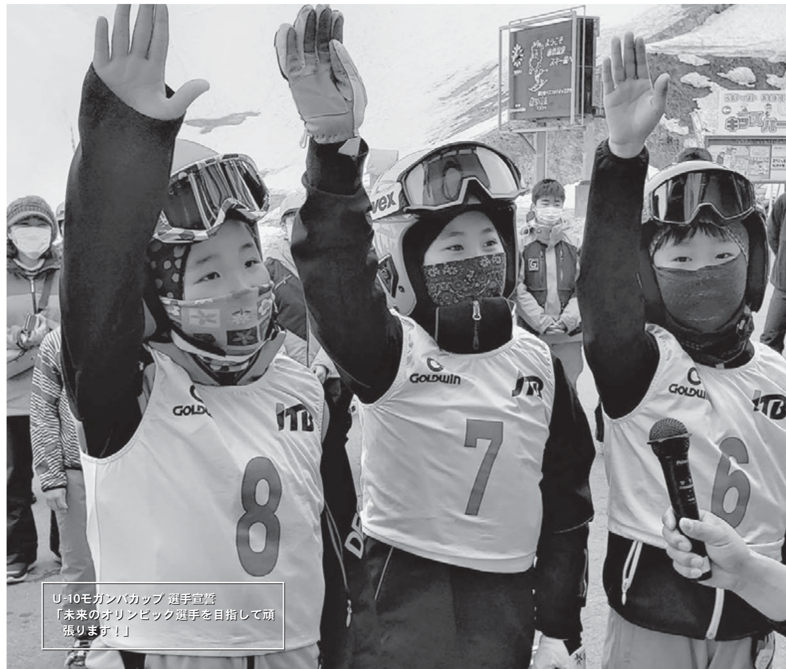
U-10モガンバカップ 選手宣誓 「未来のオリンピック選手を目指して頑張ります！」