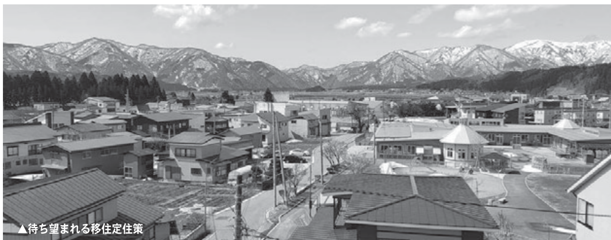
▲待ち望まれる移住定住策

答弁 来年度から、移住支援金について少し範囲を広げた要件で対応できるように変更していきます。支援できる移住者の要件緩和になる対応に行きたいと思っています。