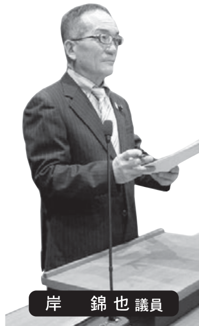
岸 錦也 議員