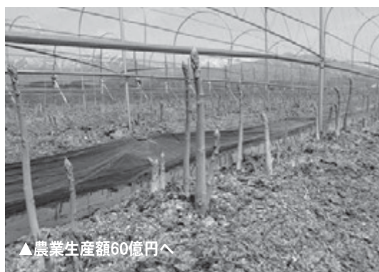
▲農業生産額60億円へ

この増加を牽引してきたアスパラガスの高止まりや、病害の懸念、農業従事者の高齢化などの減少要因もありますが、新しい栽培方式や資材の活用、更には消費者の求める新しい品目の実証試験を推し進めると共に、畜産の振興を図ることで、長期目標額を60億円とし前進する気概を込めました。