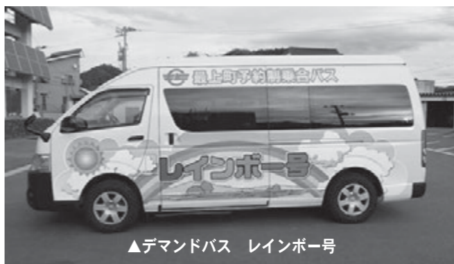
▲デマンドバス レインボー号

答 エコプラザもがみの分担金増額の内訳は、断裁式破砕機導入に関わる経費であります。布団や畳等の大きなものを破砕するため導入します。斎場維持管理分担金増額の内訳は、施設の雨漏り対策のため、屋根修繕と防水対策に関わる経費であります。