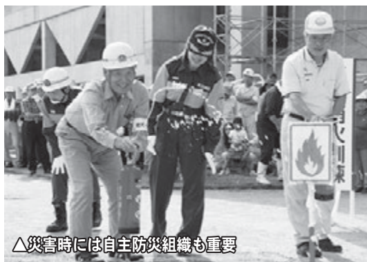
▲災害時には自主防災組織も重要