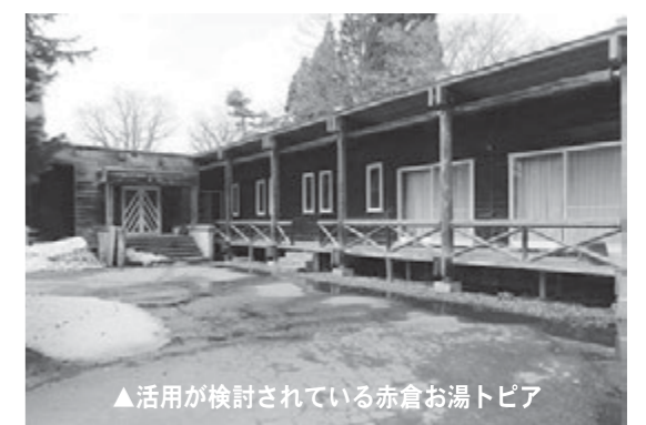
▲活用が検討されている赤倉お湯トピア

億円の経費を要すると試算したところです。町の財政運営において、選択と集中を図りながら持続可能な対策を築いていくことが今後、益々重要になってくることから、持続可能なまちづくりを着実に進めていくために、今般の定例会に置いて最上町公共施設等適正管理基金条例を上程させていただきます。