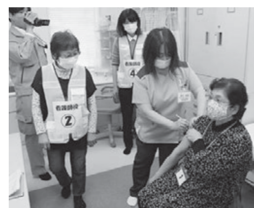
▲ワクチン接種 リハーサル風景

答 高齢者向けの接種は4月下旬 以降に健康センターでの集団接 種で準備を進めています。リハ ーサルを3月下旬に行いスムー ズな接種体制に向かっていきます。