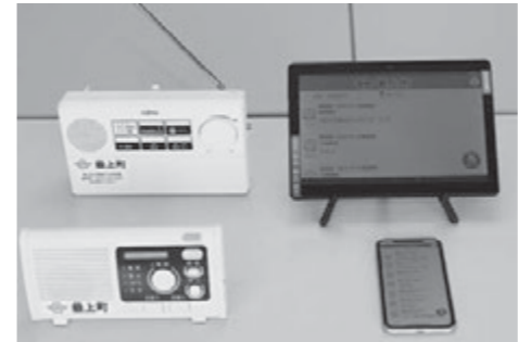
▲防災行政無線デジタル化

問 イベント案内のよう な情報や、お祭り行事 でも内容によって依頼 しても発信できないな どの状況があるが、取 り扱いの基準を明確に してはどうか？