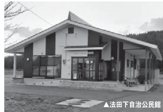
▲法田下自治公民館