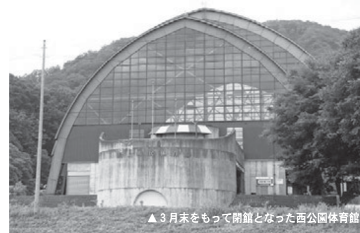
▲3月末をもって閉館となった西公園体育館

答弁 本来、町民の福祉の向上や、生活環境の維持に直結する公共インフラ施設は、適性に維持管理されなければなりません。