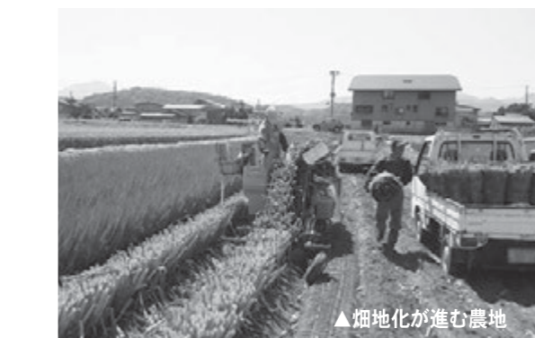
▲畑地化が進む農地

えております。最上町の農作物を故郷と想う方々を通じて全国各地に広まっている姿を思い描き、生産販売戦略を構築し担い手と地域と消費者がともに農業を創る農業政策を関係機関と一体となって実施して参りたいと考えております。 質問 町を囲む山林の杉林が伐採期を向かえ各地で切られています。また、自然状況から見て年々山々の崩壊状況が所々に見られますが、町の検証が必要であると考えますが、考えは？