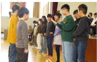
児童会活動の引継ぎ 専門委員長から5年のリーダーへ