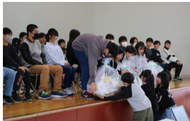
2年生からのメッセージ 手作りのプレゼントも渡しました