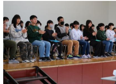
6年生全員がステージに