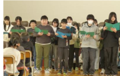
6年生からのメッセージ 最上級生らしいしっとりした空気