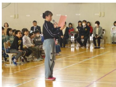
実行委員長のあいさつ