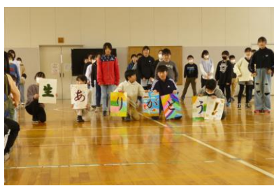
5年生からのメッセージ 最後の見せ場の文字が光ります