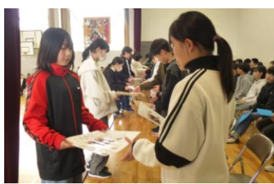
感謝の寄せ書きのプレゼント なかよし班の写真付きです