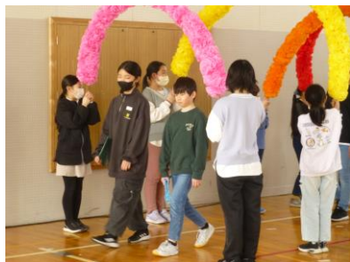
アーチをくぐって6年生入場

3月4日、最上級生として学校をリードしてきた6年生に感謝の気持ちを伝えるため、5年生が実行委員となって「6年生を送る会」を行いました。温かい気持ちが満ちていたすてきな会でした。