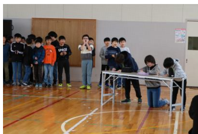
4年生からのメッセージ 6年生と計算問題で対戦しました