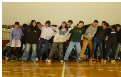
6年生からのメッセージ 最上級生らしい明るい雰囲気