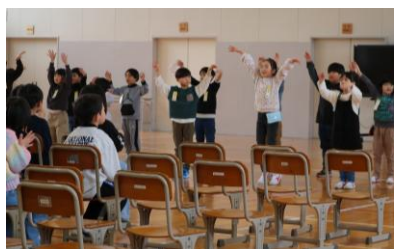
1年生からのメッセージ かわいいダンスも披露しました