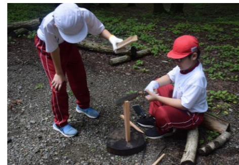
火を起こすのも ひと苦勞

みんな笑顔で協力し、「チーム5年生」として成長して帰ってきました。2日間の成果は、7月17日の授業参観で発表し、おうちの方々にも楽しかった思い出を伝えることができました。