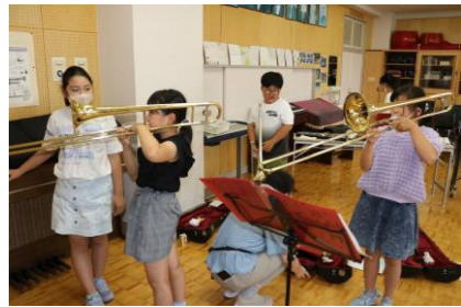
クラブ活動の様子

学校という大きな集団としては、運動会や児童会活動など自分たちで楽しい空間をつくったり、みんなの役に立つ活動を続けたりして「自分たち