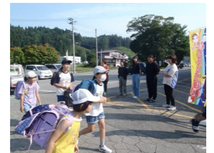
PTA 育成部の皆さんと朝のあいさつ