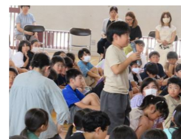
進んで自分の考えを発表