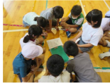
なかよし班で ウォークラリーに挑戦