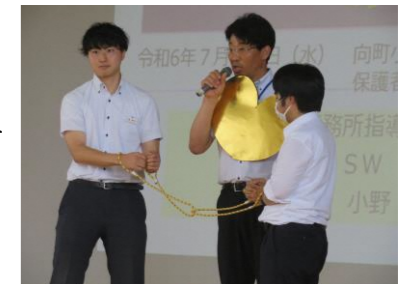
具体的な例を使っでの講演

一般的に、いじめの始まりは悪口や陰口であることが多く、一方的ないじめより、加害者が被害者に、被害者が加害者になる双方向の傾向があるそうです。それを理解し、温かい気持ちと言葉でいじめゼロの学校をめざしてほしいとおっしゃいました。