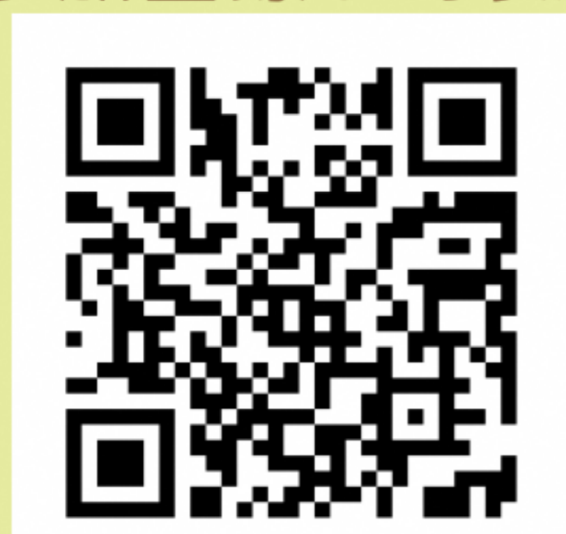
参加登録フォーム