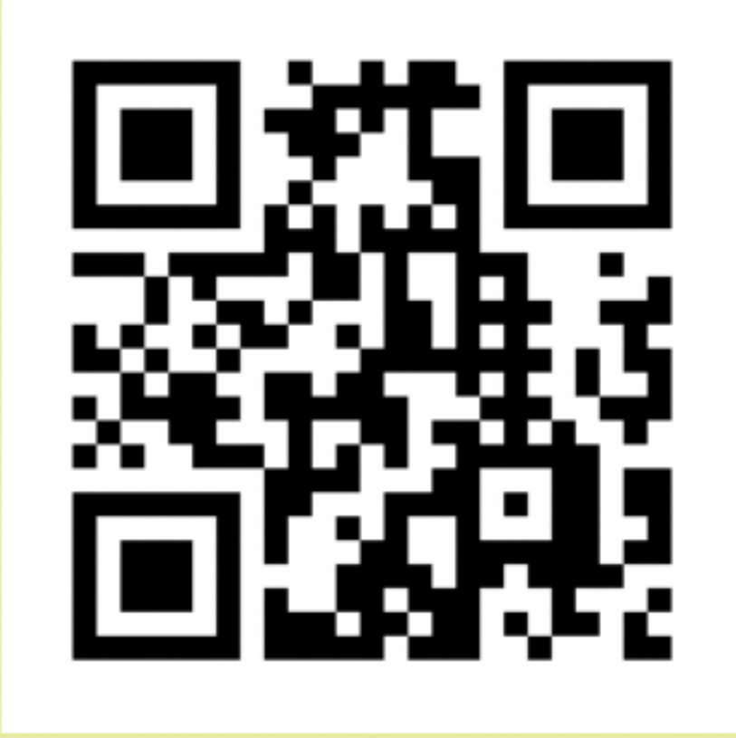
Gene Webページ QRコード