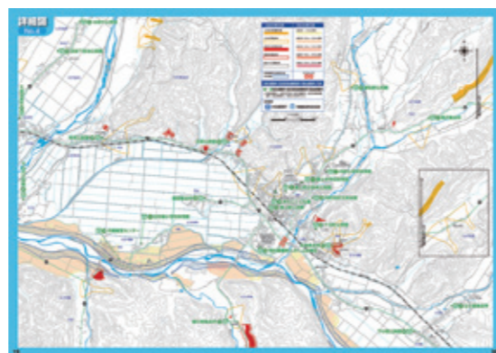
現在の浸水想定区域図