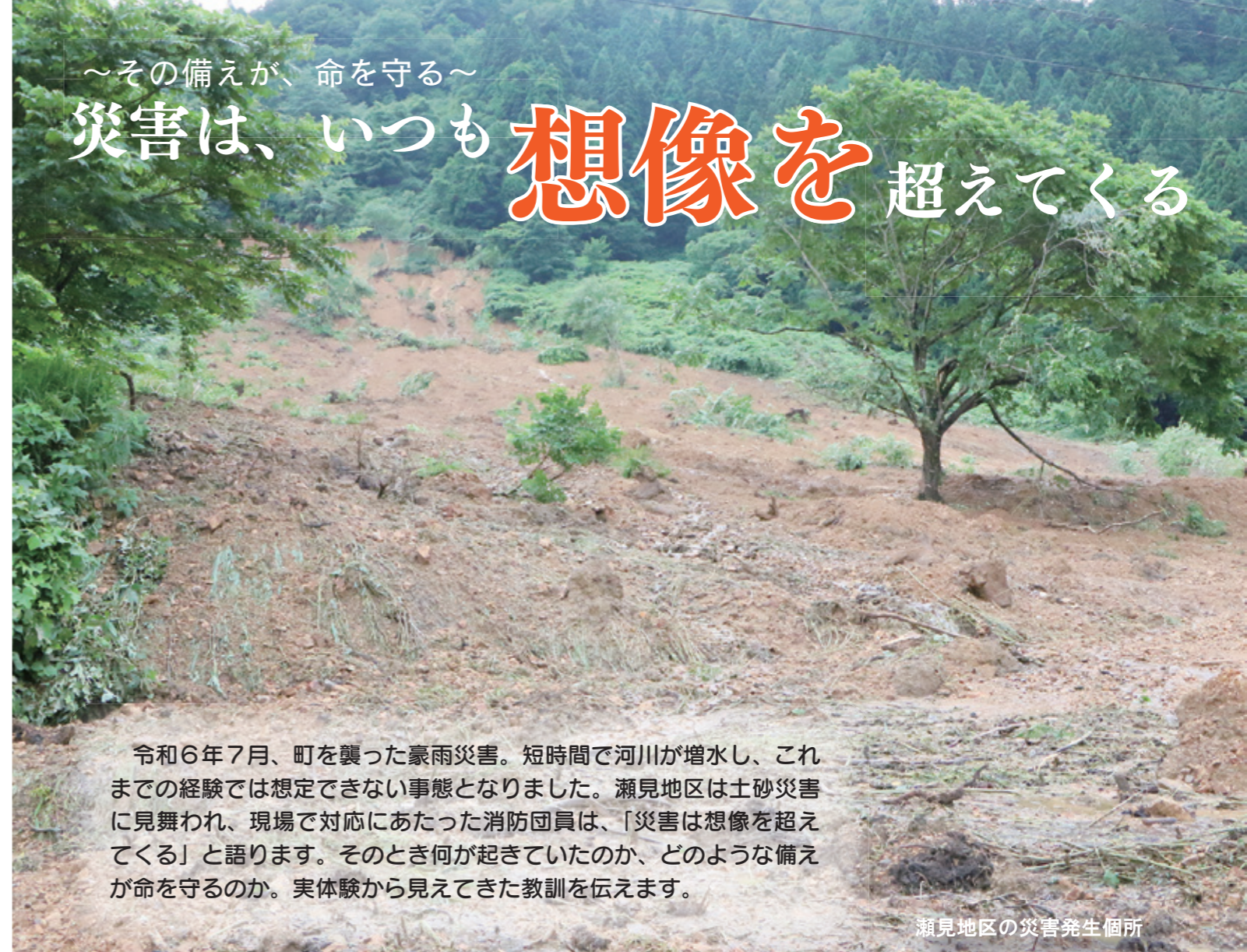
瀬見地区の災害発生箇所

令和6年7月、町を襲った豪雨災害。短時間で河川が増水し、これまでの経験では想定できない事態となりました。瀬見地区は土砂災害に見舞われ、現場で対応にあたった消防団員は、「災害は想像を超えてくる」と語ります。そのとき何が起きていたのか、どのような備えが命を守るのか。実体験から見てきた教訓を伝えます。