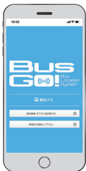
行先と駅名を選択します