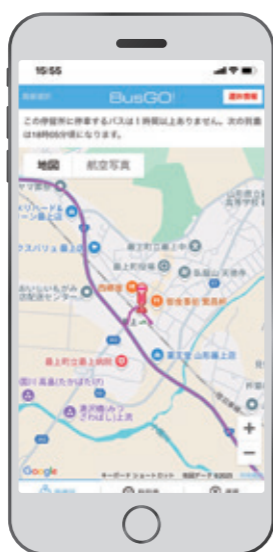
バスの現在地を確認