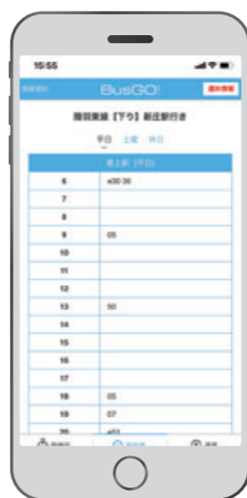
時刻表も確認できます