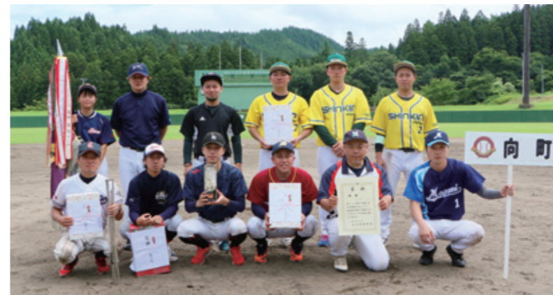
優勝した向町チーム