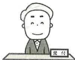
施設等の受付・宿日直