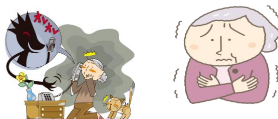
しょうひしゃひがい 消費者被害