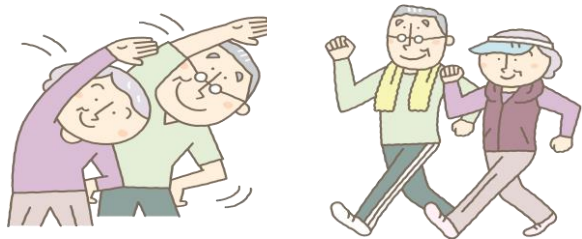
ひやくさいたいそう いきいき百歳体操 かいごぼうぎょうしつ 介護予防教室など