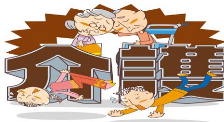
もの忘れが心配、介護の方法が分からないなど